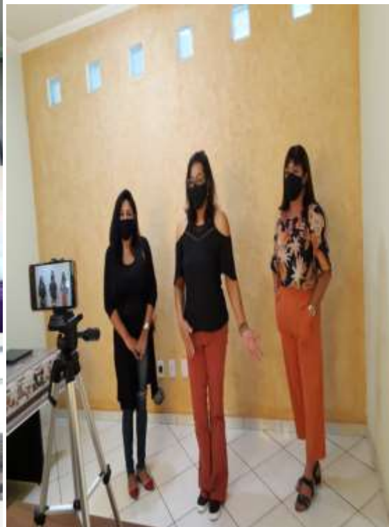
Manicure: Instrutora realizou transmissão online, através das ferramentas e